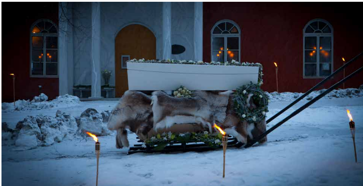
Låt årstiden vara en del av upplevelsen.