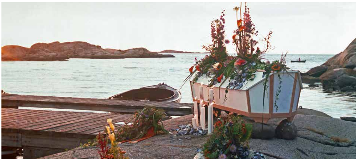
Med hav och himmel nära, känns dina nära aldrig långt bort.