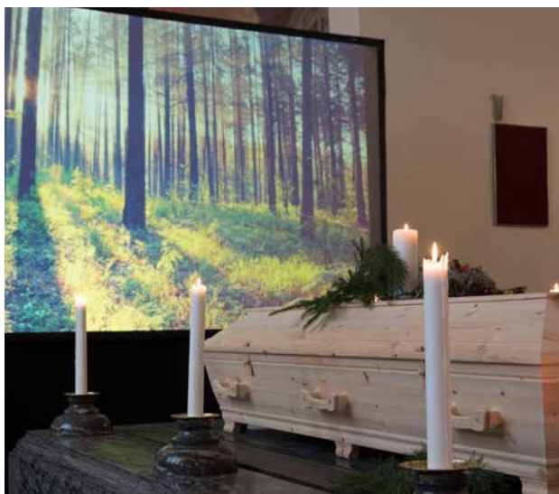
Flytta in naturen, minnen och bilder med hjälp av en storbildsskärm.