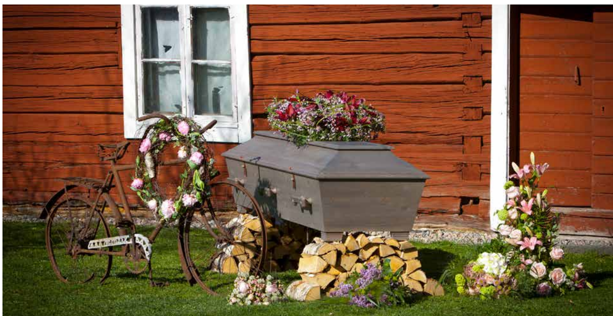
En vacker och traditionell ceremoni på en kär plats.