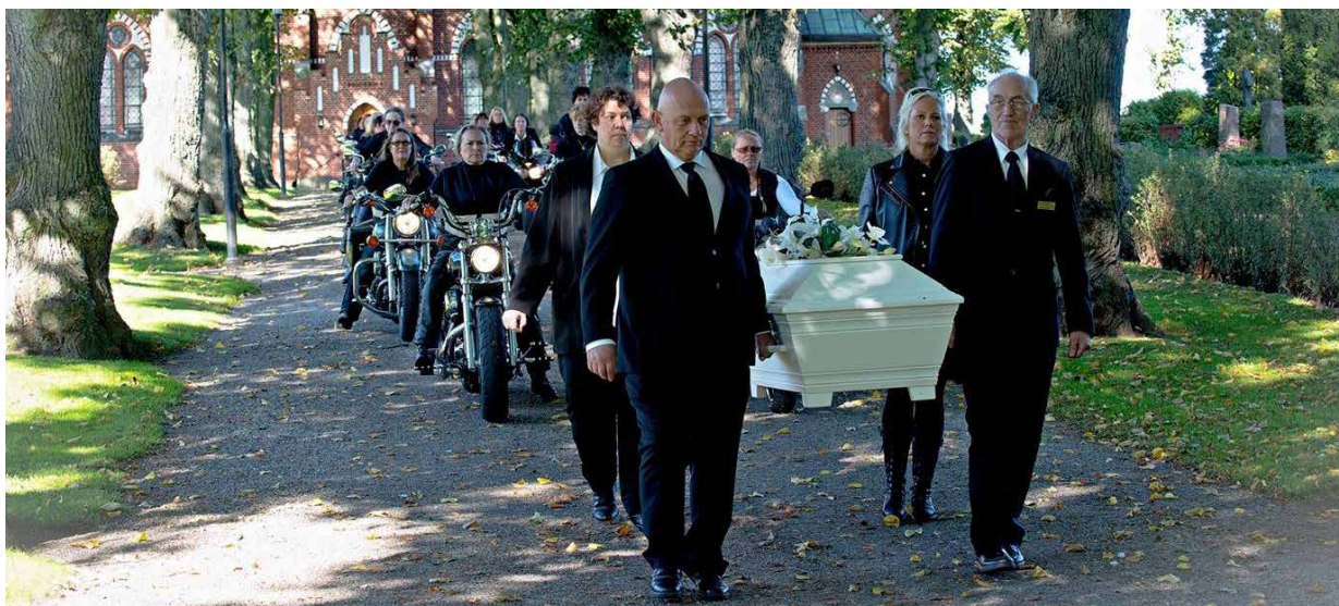
Låt ett livslångt intresse ta plats under ceremonin.