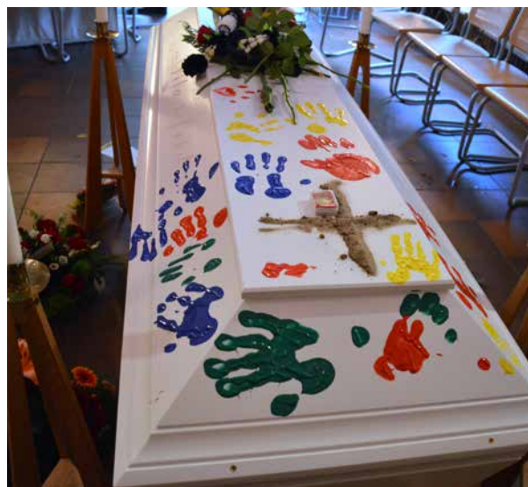
En sista hälsning med en klapp av fingerfärg.