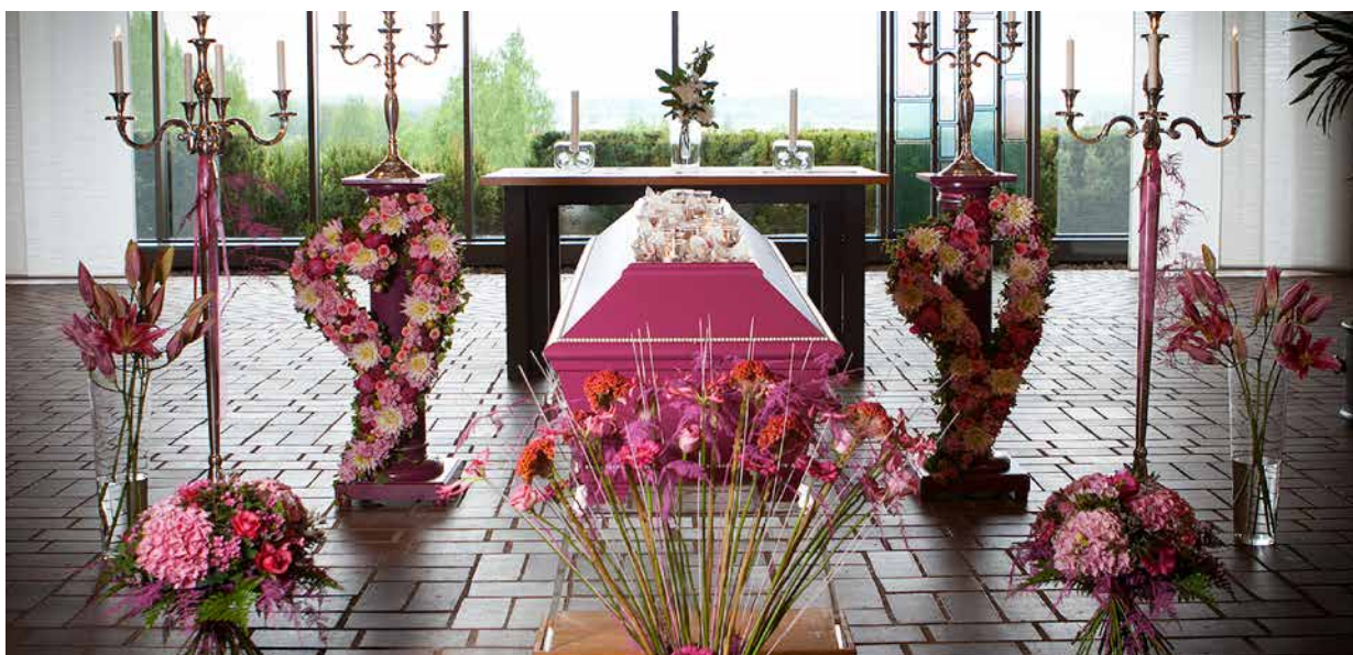
Favoritfärgen i blommor och utsmyckning gör ceremonin personlig.